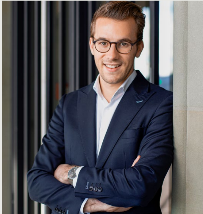
Der FDP-Nationalrat und Alumnus der ZHAW, Andri Silberschmidt, ist neuer Präsident beim Dachverband FH SCHWEIZ.

Für eine breite Vernetzung sorgen bei FH SCHWEIZ aber auch der Vorstand sowie der Beirat, zusammengesetzt aus Bundesparlamentariern fast aller Par-